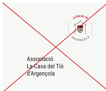
Alterar la posició dels elements