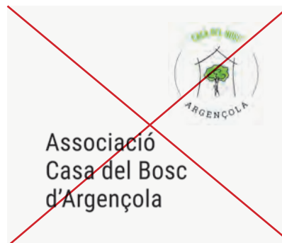
Alterar la posició dels elements